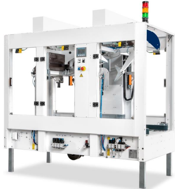
A CT 305 SDRF típusú gép alap változata